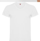
Duo Concept CA6549